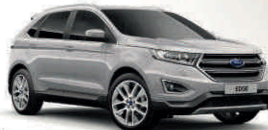
Ingot Silver Metalik* T SL