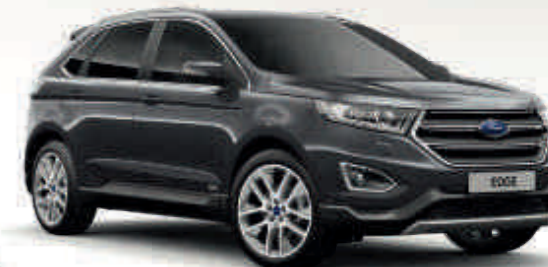
Magnetic Metalik* T V

Ford Edge ima prekrasnu i izdržljivu vanjštinu zahvaljujući posebnom višefaznom postupku nanošenja premaza. Od voskom ubrizganih čeličnih dijelova karoserije do zaštitnog gornjeg sloja, novi materijali i postupci nanošenja jamče dobar izgled Forda Edge tijekom mnogih godina.