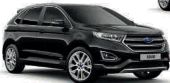
Shadow Black Metalik* T SL V