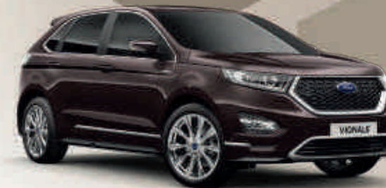
Ametista Scura † V Metalik boja karoserije