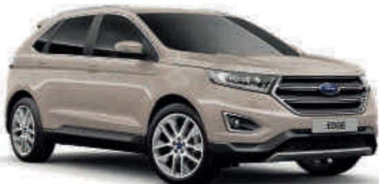
White Gold Metalik* T