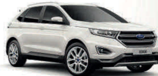
White Platinum T SL V Četveroslojna metalik boja*

T T Titanium SL SL ST-Line V V Vignale Standardno Opcija