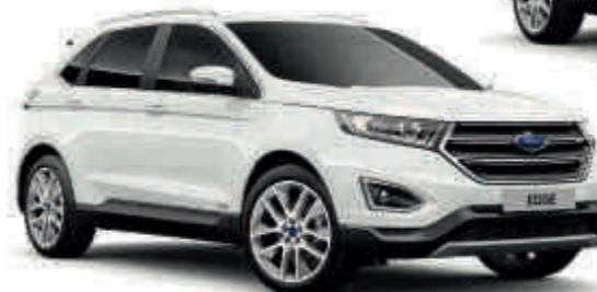
Oxford White Puna T SL