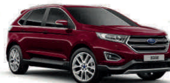
Burgundy Velvet T SL Posebne metalik boje*

Želite li isprobati različite konfiguracije Forda Edge?