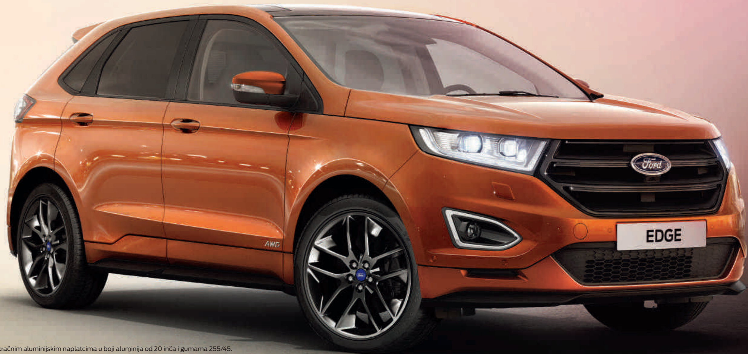
Edge ST-Line u opcionalnoj boji Canyon Ridge sa 5x2-kračnim aluminijским naplatcima u boji aluminija od 20 inča i gumama 255/45. (Slika je primjer.)