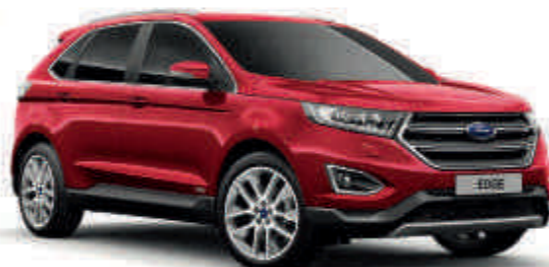
Ruby Red T SL Posebne metalik boje*

T T Titanium SL SL ST-Line V V Vignale Standardno Opcija