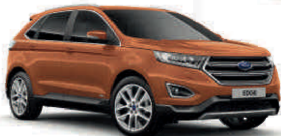
Canyon Ridge Metalik* T SL